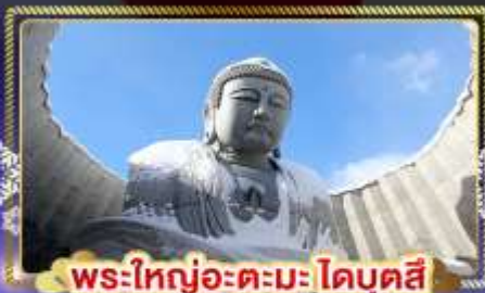
พระใหญ่อะตะมะโดบุตสึ