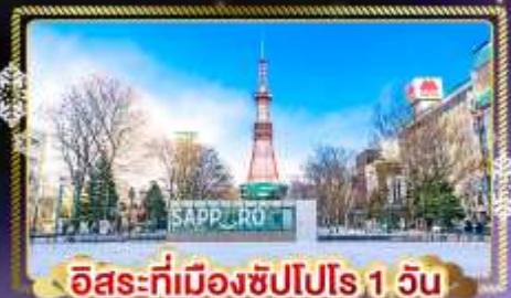
อิสระที่เมืองซัปโปโร 1 วัน