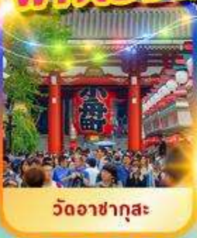
วัดอาซากุสะ