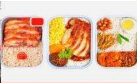
บริการอาหารร้อน ทั้งขาไป-ขากลับ