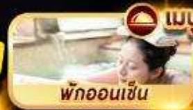
พักออนเซ็น