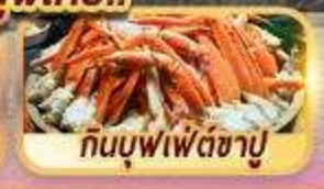
กินบุฟเฟ่ต์ซาปู