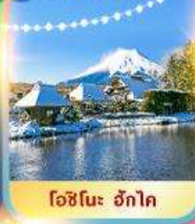
โอะชิโนะ ฮักไก