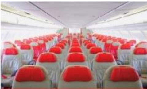
เครื่องลำใหญ่ 377 ที่นั่ง

ตัวเครื่องบินเป็นตู้กรู๊ปสำหรับคณะทัวร์ ระบบของสายการบินจะทำการแรนดอมที่นั่ง ซึ่งไม่สามารถล็อกหรือเลือกกระบุนั่งได้ หากลูกค้าต้องการเลือกกระบุนั่ง ทางสายการบินมีบริการอัพเกรดที่นั่ง (ค่าบริการเป็นไปตามที่สายการบินกำหนด)