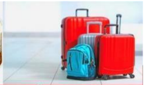
น้ำหนักกระเป๋า สูงสุด 20 กก.