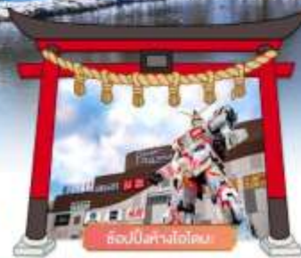
ฮอนบิงทางโอโตะ