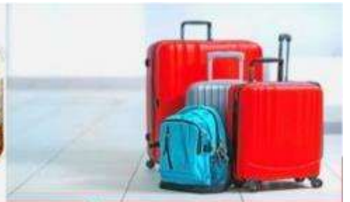
น้ำหนักกระเป๋า สูงสุด 20 กก.

08:40 ถึง สนามบินคันไซ ประเทศญี่ปุ่นดินแดนอาทิตย์อุทัย หลังผ่านพิธีศุลกากรและตรวจคนเข้าเมืองพร้อมรับสัมภาระเรียบร้อยแล้ว