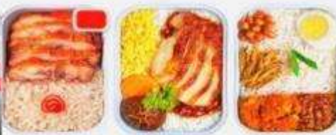
บริการอาหารร้อน ทั้งขาไป-ขากลับ