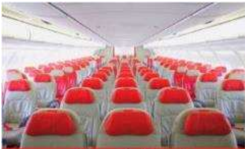
เครื่องลำใหญ่ 377 ที่นั่ง

ตัวเครื่องบินเป็นตัวกรู๊ปสำหรับคณะทัวร์ ระบบของสายการบินจะทำการแรนดอมที่นั่ง ซึ่งไม่สามารถเลือกหรือเลือกกระบุนั่งได้ หากลูกค้าต้องการเลือกกระบุนั่ง ทางสายการบินมีบริการอัพเกรดที่นั่ง (ค่าบริการเป็นไปตามที่สายการบินกำหนด)