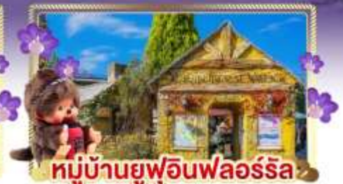
หมู่บ้านยูฟูอินฟลอร์ริล