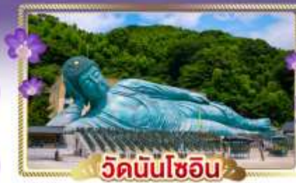
วัดนันโซอิน