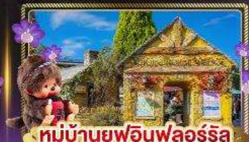
หมู่บ้านยูฟูอินฟลอร์ริล