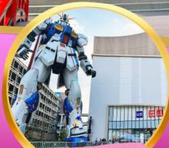
กันดั้ม ปาร์ค ฟุกุโอกะ

สัมผัสความโรแมนติก ชมซากุระในคิวชู พักออนเซ็น 1 คืนพร้อมอาหารค่ำ อิสระท่องเที่ยว 1 วันเต็มในฟุกุโอกะ