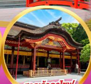
ศาลเจ้าดาโซฟุ