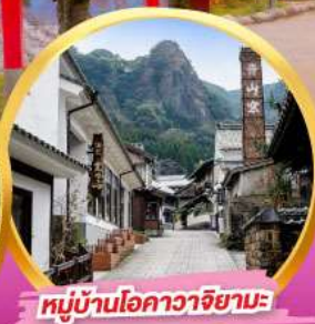
หมู่บ้านโอคาวาจิยามะ