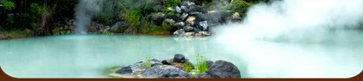
รายการทัวร์อาจมีข้อเปลี่ยนแปลงตามความเหมาะสม โดยดูสถานการณ์ประจำวันเป็นหลัก #ที่จะเที่ยวครบทุกรายการ