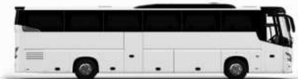
ตัวอย่างรถโดยสาร 1 คัน

ค่าที่พักตามที่ระบุในรายการหรือเทียบเท่าระดับเดียวกัน (พักห้องละ 2 ท่าน) หากประเภทห้องที่ท่านริเสวนาเป็นอาทิ เช่น ริเสวนาห้องพักเป็น TWIN BED หรือ DOUBLE BED ทางบริษัทขอสงวนสิทธิ์ในการปรับประเภทห้องพัก เป็นตามที่โรงแรมมีอยู่ โดยไม่ต้องแจ้งให้ทราบล่วงหน้า