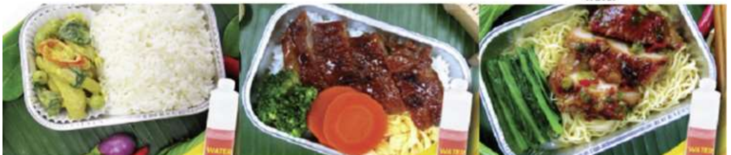
Chicken roasted with herb and noodle and water