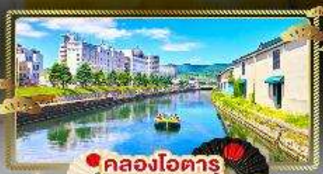
🚢 คลองโอตารุ