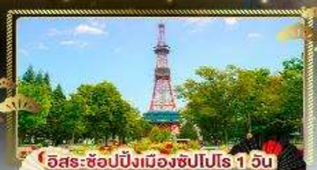
🗼️ อิสระ-ช้อปปิ้งเมืองซัปโปโร 1 วัน