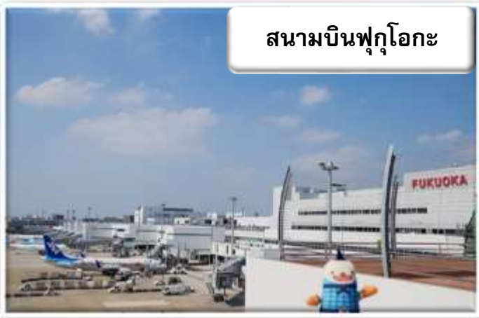
สนามบินฟูกูโอกะ

เวลา 00.50 น. ออกเดินทางสู่ สนามบินฟูกูโอกะ ประเทศญี่ปุ่น โดยสายการบินไทย เที่ยวบินที่ TG 648 เวลา 08.00 น. เดินทางถึง สนามบินฟูกูโอกะ ประเทศญี่ปุ่น นำท่านผ่านขั้นตอนการตรวจคนเข้าเมืองและศุลกากร