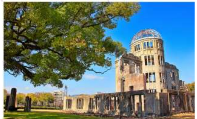
รับประทานอาหารกลางวัน ณ กัดตาคาร