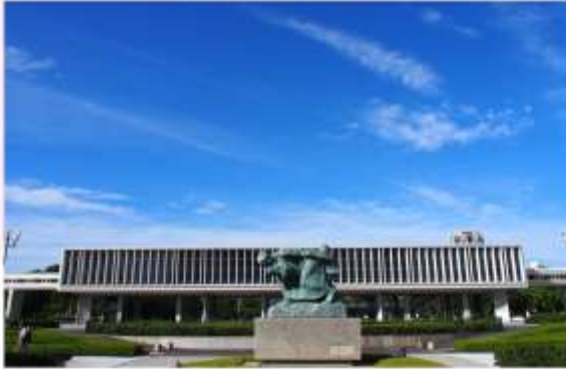
HIROSHIMA PEACE MEMORIAL MUSEUM

"พิพิธภัณฑ์สันติภาพฮิโรชิมา" ถูกสร้างขึ้นเพื่อเป็นอนุสรณ์และรำลึกถึงเหตุการณ์ระเบิดปรมาณูที่เกิดขึ้นในวันที่ 6 สิงหาคม พ.ศ. 2488 พิพิธภัณฑ์แห่งนี้เปรียบเสมือนห้องเรียนขนาดใหญ่ที่รวบรวมเรื่องราวและหลักฐานทางประวัติศาสตร์ที่น่าสะท้อใจของเหตุการณ์ระเบิดปรมาณู ผ่านภาพถ่าย วัตถุโบราณ และคำบอกเล่าของผู้รอดชีวิต