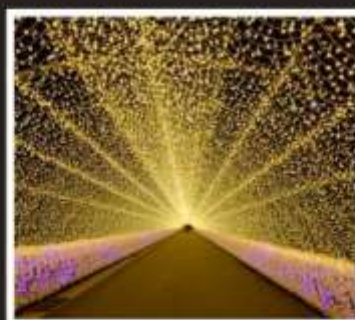
นาบานะ โนะ ซาโตะ