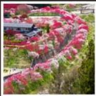
สวนฮานาโมโมะ โนะ ซาโตะ