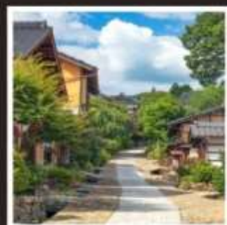
หมู่บ้านโบราณมาโกเมะจุกุ

ชิราคาวาโกะหมู่บ้านมรดกโลก ที่ทุกคนถวิลหา เยือน ศาลเจ้าอิเซะ ประตูสู่อินแดนแห่งจิตวิญญาณ ศาลเจ้าชินโตอันศักดิ์สิทธิ์ที่สุด ขึ้นกระเช้าต่อรถบัส ผจญภัยกลางกำแพงหิมะ บนเทือกเขาเจแปนแอลป์ ฮานาโมโมะ โนะ ซาโตะ ดอกท้อกลางหุบเขาที่รอคุณมาเยือน ชมแสงสียามค่ำคืนกับงานประดับไฟที่ยิ่งใหญ่ที่สุด "นาบานะ โนะ ซาโตะ" ย้อนสู่ยุคเอโดะที่มาโกเมะจุกุ หมู่บ้านที่ผสมผสานธรรมชาติและวัฒนธรรม พักออนเซ็นอย่างดี 2 คับ!!! (มีออนเซ็นเบียร์ 1 คับ) อาหารพิเศษ...คุโรกะวะทากิว บุฟเฟต์, อามะ ฟรีเมี่ยมกะเลเฟา, บุฟเฟต์เบียร์ กรุ๊ปสบายๆ เพียง 30 ท่านเท่านั้น!!!