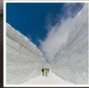
กำแพงหิมะ เจแปนแอลป์