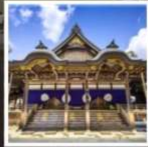
ศาลเจ้าอิเซะ