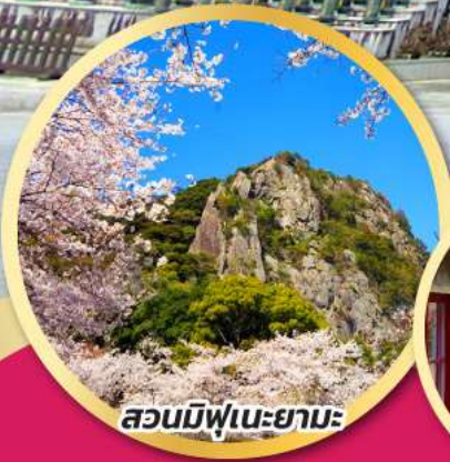
สวนมิฟูเนะยามะ