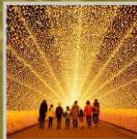
"NABANA NO SATO"