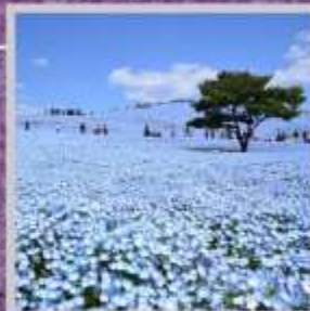
"HITACHI SEASIDE PARK"