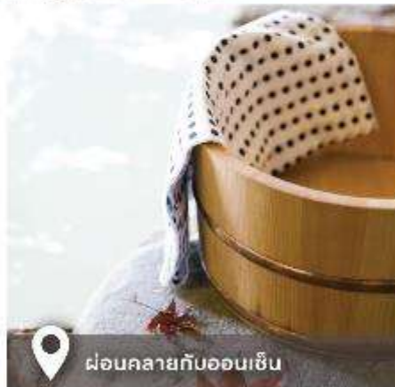
ผ่อนคลายกับออนเซ็น