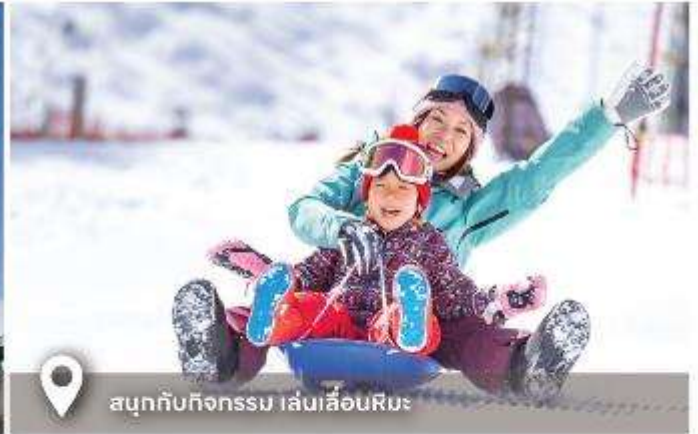
สนุกกับกิจกรรม เล่นเลื่อนหิมะ