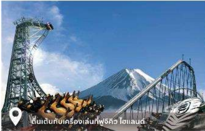
ตื่นเต้นกับเครื่องเล่นที่ฟูจิคว โฮแลนด์