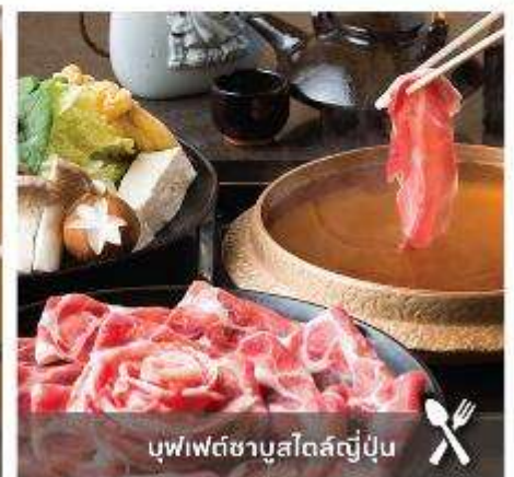
บุฟเฟต์ซาบุมิโตล้ญี่ปุ่น