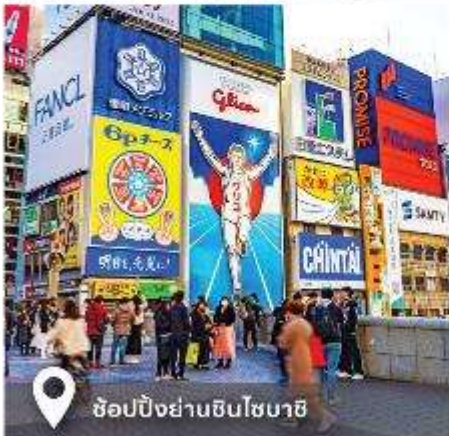
ช้อปปิ้งย่านชินโซบาชิ