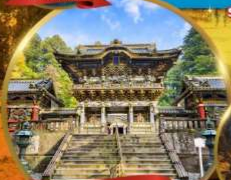
ศาลเจ้านิกโกโทโฮกุ