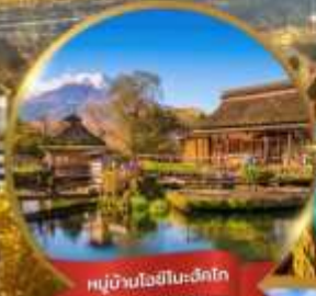
หมู่บ้านโอชิโนะฮักโก