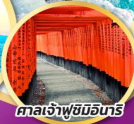
ศาลเจ้าฟูชิมิอินาริ