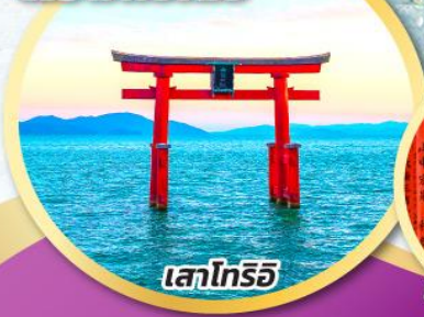
เสาโทริอิ