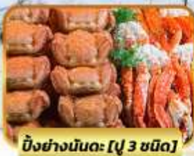
บิงย่างนินตะ [ปู 3 ชนิด]