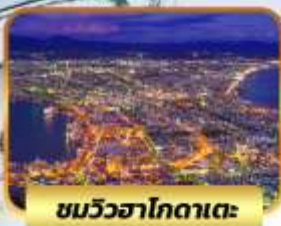
ชมวิวฮาโกดาเตะ