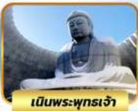
เป็นพระพุทธรเจ้า