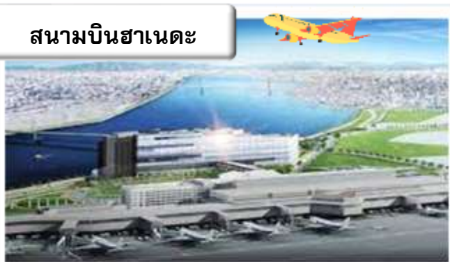
สนามบินฮานอย

22.45 น. ออกเดินทางสู่ สนามบินฮานอย ประเทศญี่ปุ่น โดย สายการบินไทย เที่ยวบินที่ TG 644