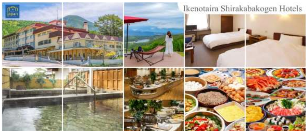
Ikenotaira Shirakabakogen Hotels

รับประทานอาหารค่ำ ณ ภัตตาคาร ของโรงแรม (5) --- บุฟเฟต์นานาชาติ หลังอาหารให้ท่านได้ผ่อนคลายกับการแช่น้ำแร่ธรรมชาติ เชื่อว่าถ้าได้แช่น้ำแร่แล้ว จะทำให้ผิวพรรณสวยงามและช่วยให้ระบบหมุนเวียนโลหิตดีขึ้น