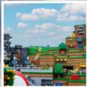
ยูนิเวอร์ซัล สตูดิโอส์ เจแปน