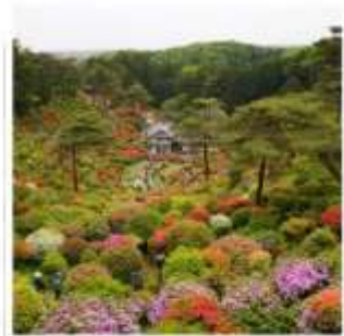
วัดชิโอะฟูเนะ คันบงจิ

โตเกียวดิสนีย์แลนด์ ดินแดนในฝันของคนทั้งโลก ฮานาโมโมะ โนะ ซาโตะ ดอกท้อกลางหุบเขาที่รอคุณมาเยือน ทางรถไฟสายเก่า เคอะเกะ อินโคลน์ 1 ในจุดชมซากุระที่สวยงามแห่งเกียวโต ขึ้นกระเช้าที่สูงที่สุดในญี่ปุ่น โคมากะทาเกะ กับแอ่งเทือกเขาสุดอัศจรรย์เขินโจจิกิ เซอร์ค ปราสาทอนูยามะ 1 ใน 12 ปราสาทดั้งเดิมกับทิวทัศน์อันแสนสวยงาม ชิโอะฟูเนะ คันบงจิ วัดแห่งดอกไม้สุด unseen ที่ไม่ควรพลาด พักออนเซ็น 2 คิน!!! // อาหารพิเศษ...บุฟเฟ่ต์บึงย่าง, บุฟเฟ่ต์ซาบู, บุฟเฟ่ต์ซาบู กรุ๊ปสบายๆ เพียง 20 ท่านเท่านั้น!!!