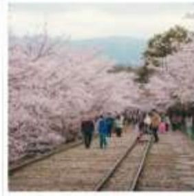
เคอะเกะ อินโคลน์