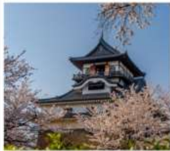
ปราสาทอนูยามะ