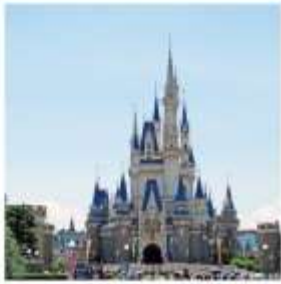
โตเกียว ดิสนีย์แลนด์