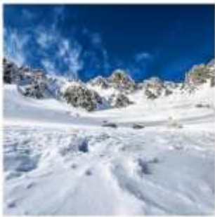
กระเช้าลอยฟ้าโคมากะทาเกะ