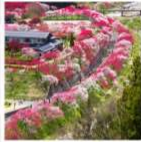
สวนฮานาโมโมะ โนะ ซาโตะ