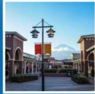
ช้อปปิ้งโทเทมบะ

สักการะพระใหญ่โตบุทสึ ที่วัดโคโตคุอินก่อนสิ้นปี ช้อปปิ้งโทเทมบะ ฟรีเหมียม เจ้าคิเลตส์ อย่างจุใจ เต็มเวลา หมู่บ้านโอชิโนะฮะคโค หมู่บ้านน้ำใสศักดิ์สิทธิ์ ประสบการณ์แสนสนุก ล่องคาบะบัส ชมฟูจิ สัมผัสวัฒนธรรมเช้าของเหล่าคนญี่ปุ่น ณ ตลาดปลาซึกิจิ เก็บภาพความประทับใจ ณ วัดโอโคะคุจิ ป่าไฟแห่งคามาคุระ พักออนเซ็น 1 คืน // อาหาร : บุฟเฟ่ต์ชาบูไม่อื่น บุฟเฟ่ต์ชาบู อิสระฟรีเดย์ 1 วัน โรงแรมไกล์รถไฟฟ้า 3 สาย ที่โตเกียว 2 คืน