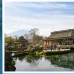
โอชิโนะฮะคโค