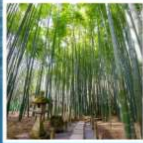
วัดโอโคะคุจิ