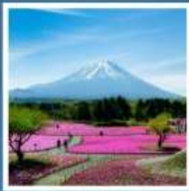
ทุ่งพืชมอส

เทศกาลชิบะซากุระ ชมดอกไม้สีชมพู 1 ปีมีเพียงครั้งเดียว ทาเกยามะ-คุโรเบะ การพิชิตเจแปนแอลป์ตอนเหนือที่ต้องไปให้ถึง ฮาคุบะอิวาตาคะ ระเบียงกระจกที่สวยงามที่สุดแห่งฮาคุบะ คามิโคจิ สัมผัสมนต์เสน่ห์สวิตเซอร์แลนด์แดนญี่ปุ่น ฟูจิยามะ ทาวเวอร์ ขึ้นชมฟูจิจากสวนสนุกที่ไม่เหมือนใคร ช้อปปิ้งจิวะชิบุคุ / อิออน พลาซ่า ของฝากต้องมี พักออนเซ็น 2 คับ!!! // อาหารพิเศษ...บุฟเฟ่ต์ซาบูยักชิ, บุฟเฟ่ต์ซาบู กรุ๊ปสบายๆ เพียง 25 ท่านเท่านั้น!!!