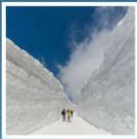
กำแพงหิมะ เจแปนแอลป์