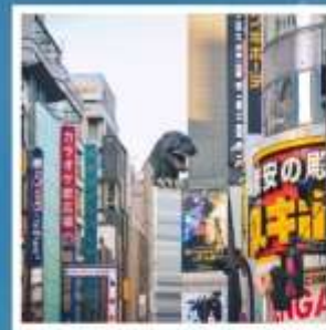
ช้อปปิ้งชิบุคุ