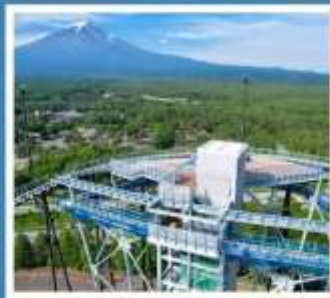
ฟูจิยามะ ทาวเวอร์