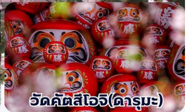
วัตต์คัตสึโอจิ(ดาร์มมะ)