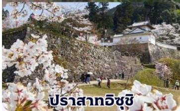
ปราสาทอิซุชิ