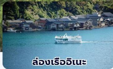
ล่องเรืออินะ