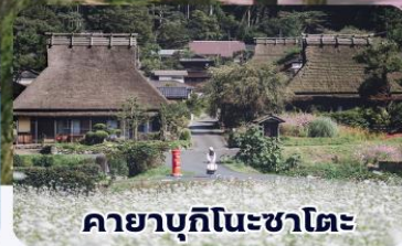
ค้ายาบุกิโนะซาโตะ