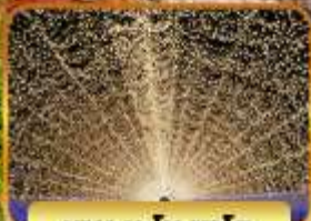
บาระบะโนะซาโตะ