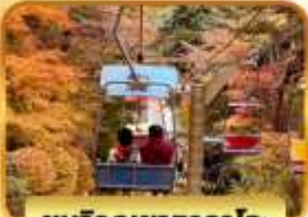
ชมวิวกุเขากาโอ