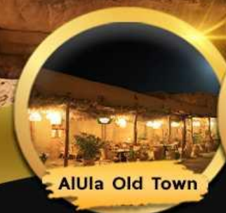
AlUla Old Town