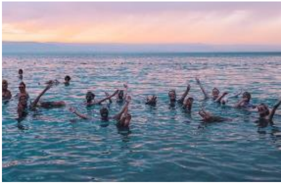
ท่านพักผ่อนตามอัธยาศัย

นำท่านเดินทางสู่ ทะเลสาบเดดซี (Dead Sea) (ใช้เวลาเดินทางประมาณ 45 นาที) หรือที่เรียกกันว่า ทะเลมรณะ อีกสมญานามหนึ่งว่าเป็น "ทะเลที่ไม่มีวันจมน้ำ" ตั้งอยู่ตรงเขตแดนประเทศจอร์แดนและอิสราเอล เป็นจุดที่ต่ำที่สุดในโลก มีความต่ำกว่าระดับน้ำทะเลถึง 400 เมตร และมีความเค็มที่สุดในโลกมากกว่า 20% ของน้ำทะเลทั่วไป ทำให้ไม่มีสิ่งมีชีวิตใดเลยอาศัยอยู่ได้ในท้องทะเลแห่งนี้ ความเข้มข้นของเกลือละลายอยู่สูงทำให้คนสามารถไปลอยน้ำในเดดซีได้ นำท่านเดินทางสู่โรงแรมที่พัก โรงแรมตั้งอยู่ริมทะเลสาบเดดซี ให้ท่านได้สนุกกับการพอกโคลน เพื่อบำรุงผิวพรรณ ให้นุ่มเนียน และเพลิดเพลินกับการลอยตัวในทะเลเดดซี เพื่อสุขภาพผิวพรรณที่ดี อิสระให้