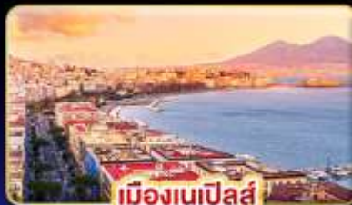
เมืองเนเป็ลส์