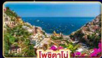
โพซิตาโน