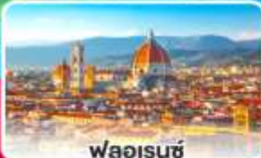
ฟลอเรนซ์