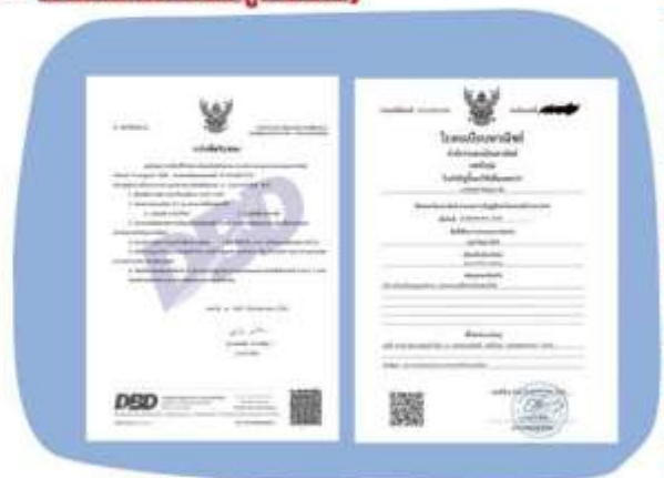
ตัวอย่างหนังสือจดทะเบียนบริษัทฯ และ ใบทะเบียนพาณิชย์