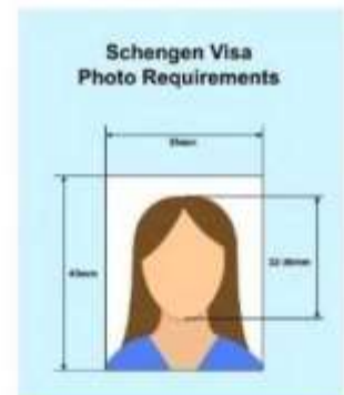
ตัวอย่างรูปถ่าย