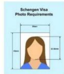
ตัวอย่างรูปถ่าย