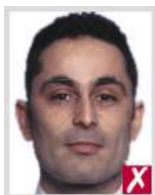
ใกล้เกินไป