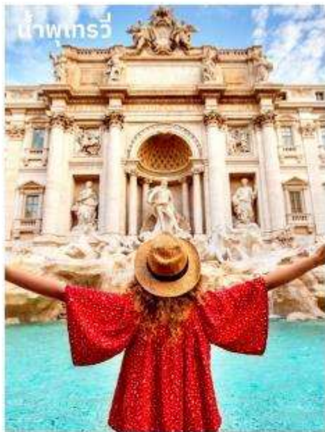
น้ำพุเทรวี

จากนั้นอิสระตามอัธยาศัยกับการเลือกซื้อสินค้าแฟชั่นและของที่ระลึกในบริเวณย่าน บันไดสเปน (The Spanish Step) ซึ่งเป็นแหล่งแฟชั่นชั้นนำสุดหรูและยังเป็นแหล่งนัดพบของชาวอิตาเลียน