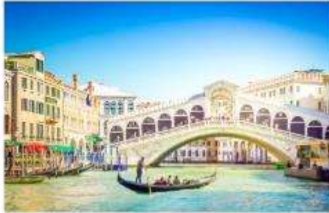
สะพานริอัลโต