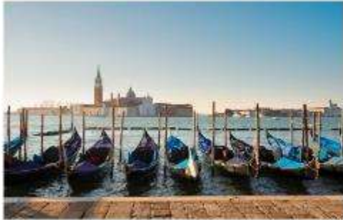
เรือกอนโดลา

นำท่านออกเดินทางสู่ ท่าเรือตรอนเคโตโต้ เพื่อเตรียมตัวนั่งเรือข้ามสู่เกาะเวนิส เกาะเวนิสเป็นดินแดนแสนโรแมนติก เป็นเมืองที่ไม่เหมือนใคร โดยใช้เรือแทนรถ ใช้คลองแทนถนน มีสมญานามว่าเป็น “ราชินีแห่งทะเลเอเดรียติก” มีเกาะน้อยใหญ่กว่า 118 เกาะและมีสะพานเชื่อมถึงกัน กว่า 400 แห่ง