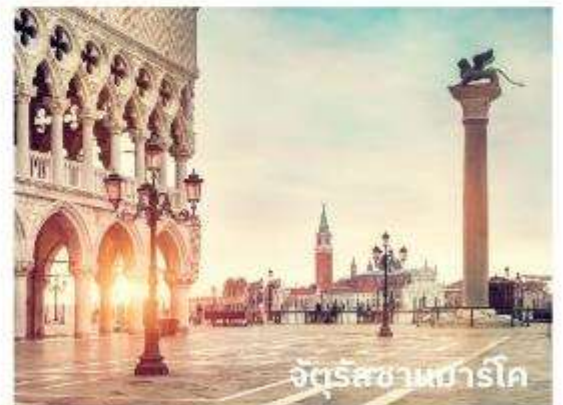
จัตุรัสซานมาร์โค

ท่านสามารถทำการสแกน QR CODE นี้ เพื่อรับชม เกาะเวนิส ในรูปแบบวิดีโอ