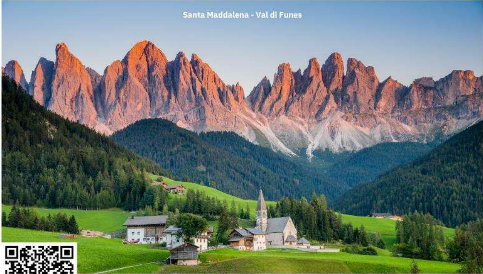
Santa Maddalena - Val di Funes

จากนั้นนำท่านเดินทางสู่ ชุมชน Val di Funes ใช้เวลาเดินทางประมาณ 1.30 ชั่วโมง ชุมชนเล็กๆ ทางภาคตะวันตกของอุทยานโดโลไมต์ ประกอบไปด้วยหมู่บ้านเล็กๆ 6 หมู่บ้าน โดยมีชื่อเสียงจากการมีวิวทิวทัศน์ที่สวยงามที่สุดในเขต South Tyrol อีสระให้ท่านเก็บภาพความประทับใจ จากนั้นนำท่านเก็บภาพความประทับใจอีกหนึ่งสถานที่ ณ โบสถ์ Santa Maddalena โบสถ์ที่ถือเป็นสถานที่ไฮไลท์ที่ถูกถ่ายรูปมากที่สุดในอุทยานโดโลไมต์ มีวิวทิวทัศน์ที่สวยงามมีฉากหลังเป็นเทือกเขา Odles (การเดินทางขึ้นไปเก็บภาพความประทับใจนี้ ท่านจะต้องเดินขึ้นลงเนินไปและกลับประมาณ 2 กิโลเมตร เพื่อไปเก็บภาพ)