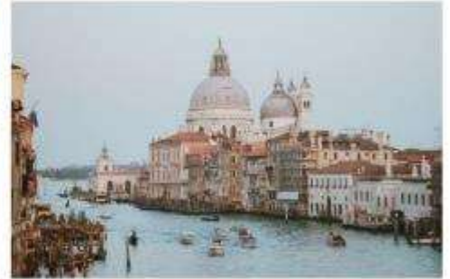
แตรนด์คาแนล

นำทุกท่านนั่งเรือต่อเพื่อไปยัง ท่าเรือซานมาร์โค (San Marco Pier) บนเกาะเวนิส แวะให้ท่านถ่ายรูปสวยๆ เก็บเป็นที่ระลึกกันที่ พระราชวังดอดจ์ พระราชวังริมน้ำแสนอลังการ ที่สร้างตั้งแต่ศตวรรษที่ 14 ในสไตล์เวเนเซียนโกธิค ที่เคยเป็นที่ประทับของผู้ปกครองของเวนิส แต่ตั้งแต่ปี 1923 ก็ได้เปลี่ยนเป็นพิพิธภัณฑ์ให้คนทั่วไปได้เข้าชม เป็นหนึ่งในแลนด์มาร์กหลักของเวนิส จากนั้นเดินเที่ยวชมแลนด์มาร์คสำคัญต่างๆ ในเมือง จัตุรัสเซนต์มาร์ค เป็นจัตุรัสหลักของเมืองเวนิส และยังเป็นศูนย์กลางเมืองตั้งแต่โบราณ จากนั้นนำท่านถ่ายรูปกับ มหาวิหารเซนต์มาร์ค มหาวิหารใหญ่ ของศาสนาคริสต์นิกายโรมันคาทอลิก อลังการด้วยการตกแต่งด้วยโดมใหญ่ และที่อยู่ติดกันและโดดเด่นด้วยความสูงถึง 50 เมตรก็คือ หอรบั้ง ถือเป็นหนึ่งในสัญลักษณ์ของเมืองที่ เห็นได้ไม่ว่าจะอยู่มุมไหนของเมืองก็ตาม และที่พลาดไม่ได้เลยก็คือ สะพานถอนหายใจ สะพานอันโด่งดังแห่งนี้ตั้งอยู่เหนือแม่น้ำที่คั่นกลางระหว่างคูเก่ากับพระราชวังดอดจ์