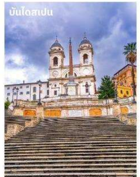
บันไดสเปน