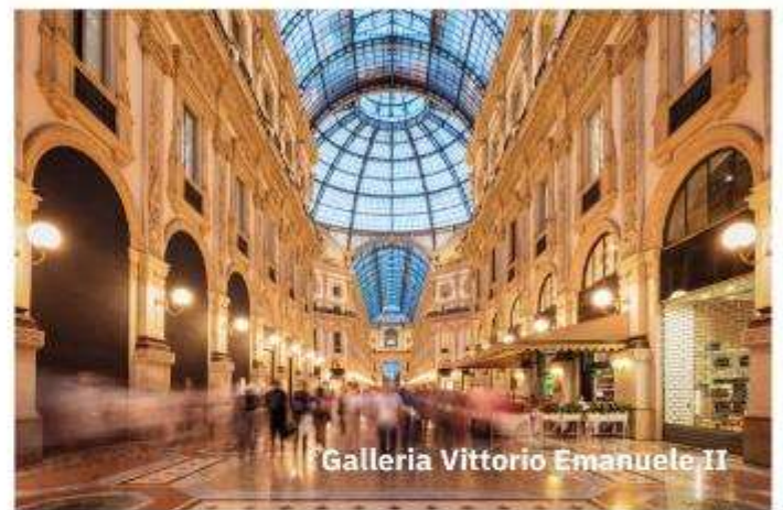
Galleria Vittorio Emanuele II

อิสระช้อปปิ้ง ที่ Galleria Vittorio Emanuele II ที่ตั้งอยู่ทางฝั่งขวาของมหาวิหารมิลาน เป็นห้างสรรพสินค้าที่เก่าแก่ที่สุดในอิตาลี โดยสร้างขึ้นในปี 1877 มากมายด้วยร้านค้า ร้านอาหาร จุดเด่นของอาคารก็คือหลังคาทรงโดมเป็นกระจกใส ทำให้สามารถช้อปปิ้งได้ในทุกสภาพอากาศ ได้เวลาอันสมควรนำท่านสู่สนามบิน