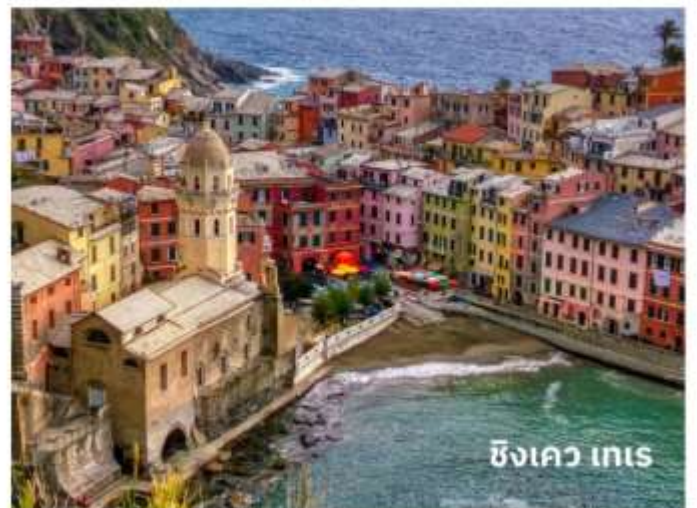
ซังควา เทเร

ท่านสามารถทำการสแกน QR CODE นี้ เพื่อรับชม “ซังควาเทเร” ในรูปแบบวิดีโอ