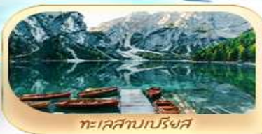
ทะเลสาบปรีงส์