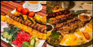
อาหารท้องถิ่นอิหร่านสุดพิเศษ