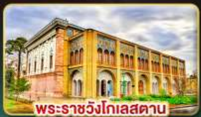
พระราชวังโกเลสถาน

เยือนอารยธรรมเปอร์เซีย เก็บครบทุกไฮไลต์สำคัญ