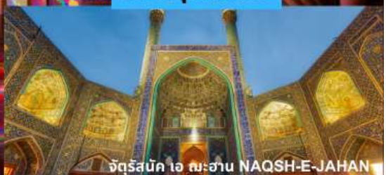
จัตุรัสบิก ไอ ฉะฮาน NAQSH-E-JAHAN