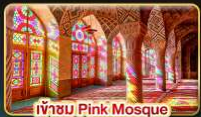
เข้าชม Pink Mosque