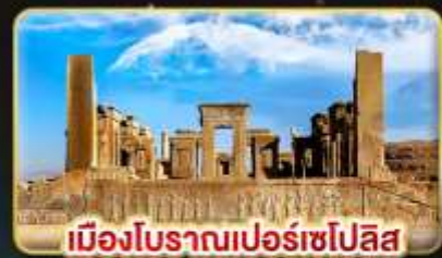
เมืองโบราณเปอร์เซโปลิส

✈️ บินตรง กรุงเทพฯ - เตหะราน บินภายใน ชีราซ - เตหะราน