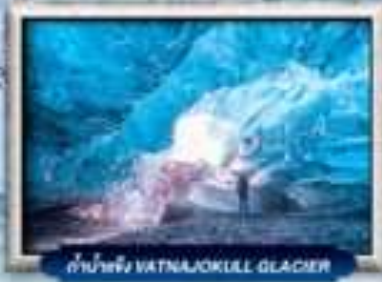
ดำน้ำหิม WATNAJOKULL GLACIER

บินทรู สายการบิน Full Service | พิเศษ! ทานอาหารโคตรจกั๋วจกั๋ว 360 องศา