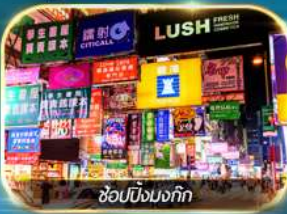
ช้อปปิ้งมงก๊ก

เต็มอิ่มทั้งบุญ และ ช้อปปังแบบจัดเต็ม จิมซาจุ้ย มงก๊ก