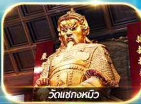
วัดเขากงหมิว