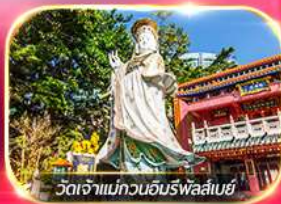
วัดเจ้าแม่กวนอิมพรหลัสเบย์