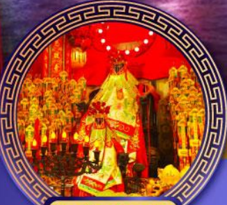
วัดเจ้าแม่กวนอิม ฮองฮำ