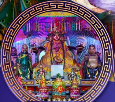
ศาลเจ้าหั่งเจีย