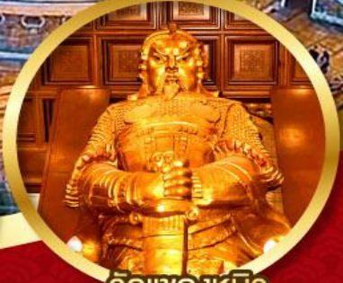
วัดแชกงหมิว ขอพรโชคลาภ การเงิน และ ธุรกิจ