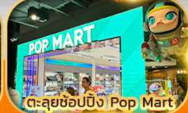
ตะลุยช้อปปิ้ง Ping Pop Mart