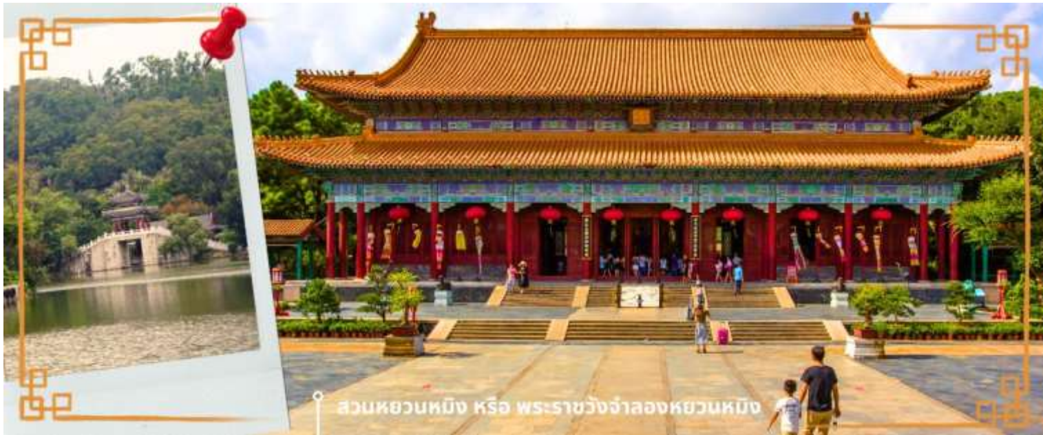
สวนหວนหมิง หรือ พระราชวังจำลองหວນหมิง

จากนั้นนำท่าน อิสระช้อปปิ้งตลาดใต้ดินกงเป๋ย ตั้งอยู่ติดชายแดนมาเก๊า เป็นศูนย์การค้าติดแอร์ ที่มีร้านค้ามากกว่า 5,000 ร้านค้า มีสินค้าให้ท่านเลือกมากมาย เช่น สินค้าก๊อปปี้แบรนด์เนมต่างๆ ไม่ว่าจะเป็นเสื้อผ้า รองเท้า กระเป๋า นาฬิกา ของเด็กเล่น ฯลฯ ที่นี่ มีสินค้าให้เลือกซื้อหลากหลาย จึงเป็นที่นิยมมากของชาวมาเก๊าและฮ่องกง เนื่องจากสินค้าที่นี่มีคุณภาพและราคาถูก