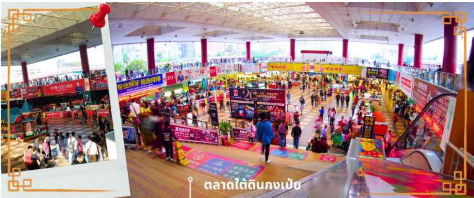
ตลาดใต้ดินกงเป๋ย

จากนั้นนำท่าน อิสระช้อปปิ้งตลาดใต้ดินกงเป๋ย ตั้งอยู่ติดชายแดนมาเก๊า เป็นศูนย์การค้าติดแอร์ ที่มีร้านค้ามากกว่า 5,000 ร้านค้า มีสินค้าให้ท่านเลือกมากมาย เช่น สินค้าก๊อปปี้แบรนด์เนมต่างๆ ไม่ว่าจะเป็นเสื้อผ้า รองเท้า กระเป๋า นาฬิกา ของเด็กเล่น ฯลฯ ที่นี่ มีสินค้าให้เลือกซื้อหลากหลาย จึงเป็นที่นิยมมากของชาวมาเก๊าและฮ่องกง เนื่องจากสินค้าที่นี่มีคุณภาพและราคาถูก