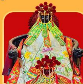
เจ้าแม่กวนอิมสองอำ