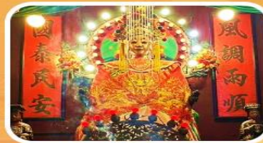
วัดเจ้าแม่กวนอิมเทียนหัว