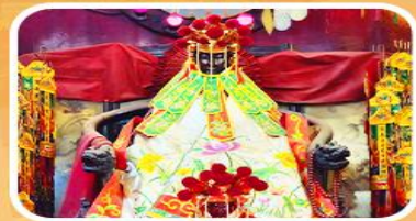
วัดเจ้าแม่กวนอิมสองอ่า