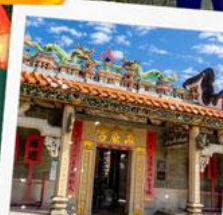
วัดปักไต้