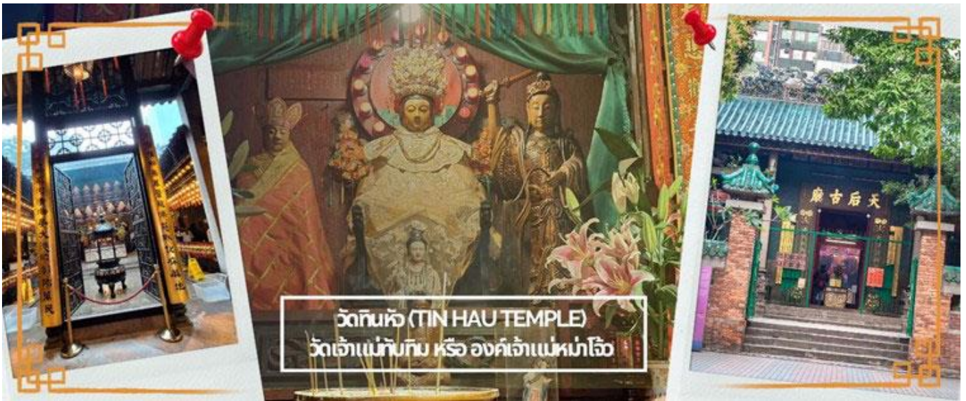
วัดทินหัว (TIN HAU TEMPLE) วัดเจ้าแม่ทับทิม หรือ องค์เจ้าแม่ทับทิม

จากนั้นนำท่านเดินทางสู่ วัดหลินฟ้า (LIN FA KUNG TEMPLE) หรือ วัดดอกบัว เป็นวัดจีนตั้งอยู่บริเวณ หวานจ้าย คอสเวย์เบย์ มีเจ้าแม่กวนอิม เป็นองค์ประธานของวัด สร้างขึ้นในปี 1863 มีตำนานเล่าว่า เจ้าแม่กวนอิมเคยปรากฏกายที่วัดแห่งนี้ เป็นที่เลื่อมใสของชาวบ้าน จึงร่วมใจกันสร้างวิหารลักษณะ คล้ายดอกบัวนี้ขึ้น และประดับด้วยโคมไฟดอกบัวร้อยโคม เมื่อมองเข้าไปด้านในวิหารจะทำให้รู้สึกถึงความเจริญรุ่งเรือง เปรียบเสมือนว่าแค่มาไหว้เจ้าแม่กวนอิมที่วัดแห่งนี้ก็ทำให้ผู้มาเยือนได้มีชีวิตที่ เจริญรุ่งเรืองยิ่งขึ้นไป และยังมี เทพเจ้าสาวจื่อเอี้ยะ (เทพเจ้าสายนรก) เป็นเทพที่ขึ้นชื่อเรื่องความ กตัญญู และด้านเงินทอง ผู้ใดที่ได้ไปไหว้ขอพรท่าน เชื่อว่าจะทำให้มีโชคลาภแบบไม่คาดคิด และสมหวัง อย่างรวดเร็ว ใครที่ชอบเสี่ยงโชค เสี่ยงดวง ห้ามพลาดเลยทีเดียว