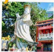
เจ้าแม่กวนอิมรพัสลัมย์

23 กุมภาพันธ์ 2568 วันเยี่ยมเงินเจ้าแม่กวนอิม วัดสองอำ