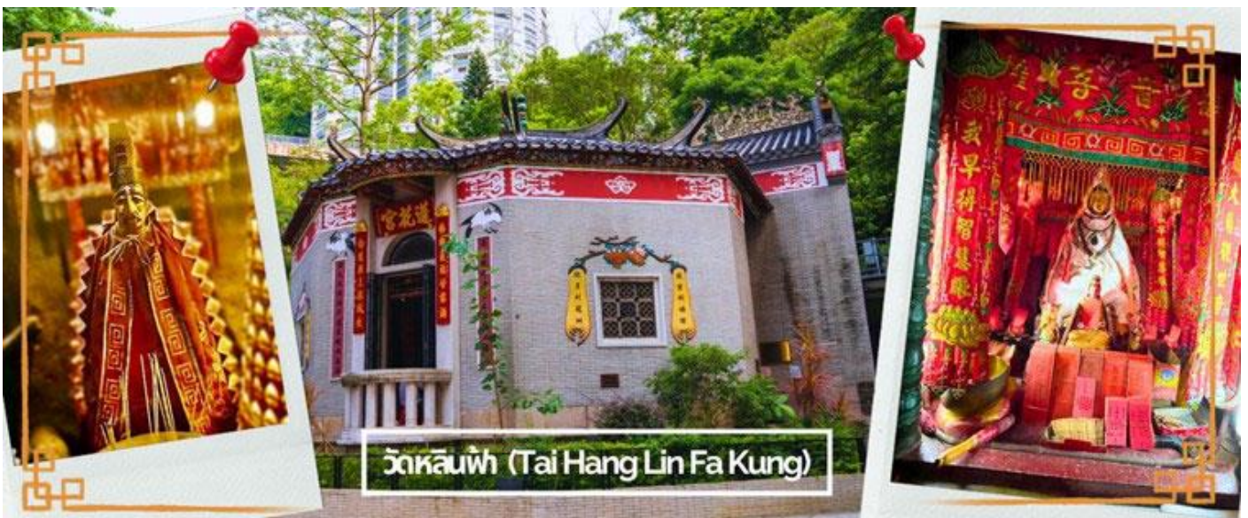
วัดหลินฟ้า (Tai Hang Lin Fa Kung)

จากนั้นนำท่านเดินทางสู่ วัดหลินฟ้า (LIN FA KUNG TEMPLE) หรือ วัดดอกบัว เป็นวัดจีนตั้งอยู่บริเวณ หวานจ้าย คอสเวย์เบย์ มีเจ้าแม่กวนอิม เป็นองค์ประธานของวัด สร้างขึ้นในปี 1863 มีตำนานเล่าว่า เจ้าแม่กวนอิมเคยปรากฏกายที่วัดแห่งนี้ เป็นที่เลื่อมใสของชาวบ้าน จึงร่วมใจกันสร้างวิหารลักษณะ คล้ายดอกบัวนี้ขึ้น และประดับด้วยโคมไฟดอกบัวร้อยโคม เมื่อมองเข้าไปด้านในวิหารจะทำให้รู้สึกถึงความเจริญรุ่งเรือง เปรียบเสมือนว่าแค่มาไหว้เจ้าแม่กวนอิมที่วัดแห่งนี้ก็ทำให้ผู้มาเยือนได้มีชีวิตที่ เจริญรุ่งเรืองยิ่งขึ้นไป และยังมี เทพเจ้าสาวจื่อเอี้ยะ (เทพเจ้าสายนรก) เป็นเทพที่ขึ้นชื่อเรื่องความ กตัญญู และด้านเงินทอง ผู้ใดที่ได้ไปไหว้ขอพรท่าน เชื่อว่าจะทำให้มีโชคลาภแบบไม่คาดคิด และสมหวัง อย่างรวดเร็ว ใครที่ชอบเสี่ยงโชค เสี่ยงดวง ห้ามพลาดเลยทีเดียว